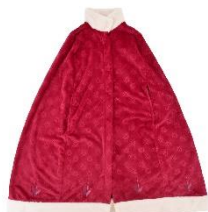
ブランケット 4,800 円