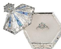
リング&リングケース 3,000円