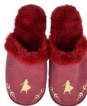
ルームシューズ 3,000 円