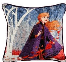
クッション 3,000 円