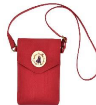
モバイルポシェット 2,300 円