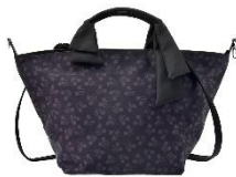
トートバッグ 2WAY （ブラック） 3,900円