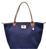
トートバッグ（ネイビー） 4,500円