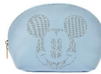
ポーチ（ブルーグレー） 1,600円