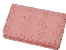
名刺入れ（ピンク） 2,000円