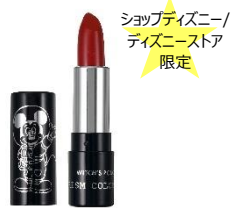
プリズムカラーリップ <ミッキー・マウス> 1,400 円