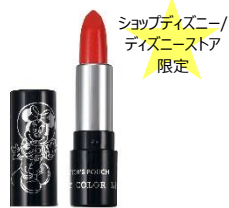
プリズムカラーリップ <ミニーマウス> 1,400 円