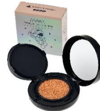
クッションファンデーション 2,600 円