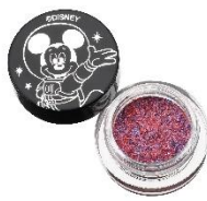
プリズムカラーピグメント <ミッキー・マウス> 1,400 円