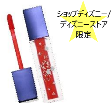
リキッドリップスティック <ミッキー・マウス> 1,600 円