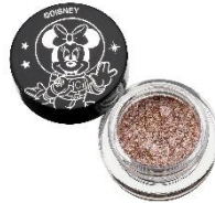
プリズムカラーピグメント <ミニーマウス> 1,400 円