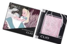
クリオ プロ シングル シャドウ <G12 VIOLET FANTASY> 1,430 円