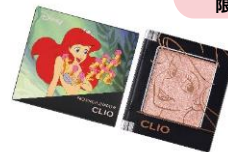
クリオ プロ シングル シャドウ <G16 CANDY TOPPING> 1,430 円