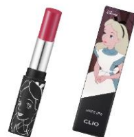
クリオ マッド マット リップ <24 ROSE MARE> 2,200 円