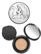
クリオ キル カバー ファンウェア クッション エクスペー <03 LINEN> 3,410 円