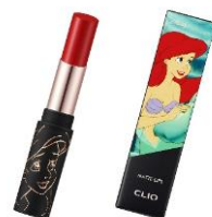
クリオ マッド マット リップ <27 BRICK STUD> 2,200 円