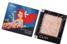
クリオ プロ シングル シャドウ <G10 PEARLFECTION> 1,430 円