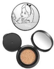
クリオ キル カバー ファンウェア クッション エクスペー <04 GINGER> 3,410 円