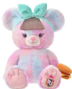
ユニベアシティ ぬいぐるみ <ペパロニ> 6,050 円

少し大きめのほっぺちやりボディとさらさらの前髪、ハンバーガーがポイント！ハンバーガーをモグモグ食べながら、ごろ寝するボーリングも楽しめます。淡いピンクのグラデーションカラーのボディはベアそれぞれで異なります。お気に入りのユニベアを探してください♪