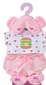
ユニベアシティ ぬいぐるみ 専用コスチューム 5,500 円

ストーリーの中でペパロニが楽屋で身に着けているルームウェア。大きなハンバーガーがプリントされた T シャツとショートパンツでリラックス。セットのアイマスクとルームシューズは、ふわふわ素材とお顔の刺しゅうに見ているだけで癒されるデザインです。