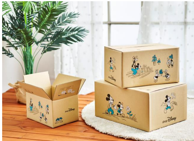
オリジナルデザインの配送ボックス