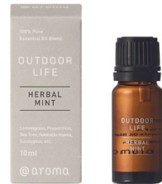
エッセンシャルオイル