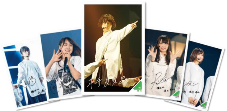
【どのカードなのかは、出てからの楽しみ！】