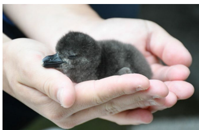
生後2日目の「まるん」