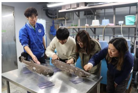
ゾクゾクタッチ (後期)

参加方法：予約サイト「アズビュー！」にて「ゾクゾク深海ツアーチケット」をご購入ください