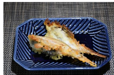
飼育スタッフが未利用魚を使用して調理したサンゴイワシの天ぷら

美味しくてサイズが規格外であったり、見た目が悪い、知名度が低いなどの理由により、市場で利用されない「未利用魚」に焦点を当て、実際に飼育スタッフが深海生物の未利用魚を美味しく調理した内容をパネルでご紹介します。未利用魚に隠された魅力と併せてご案内します。