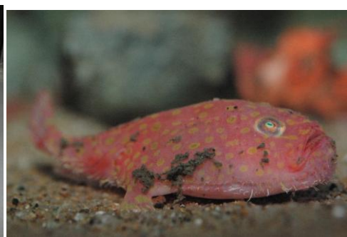
ミドリフサアンコウ 生体展示