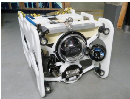
水中ドローンの実物展示