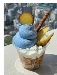
【11月】ダイヤモンド富士 日輪焼き芋ワフエ