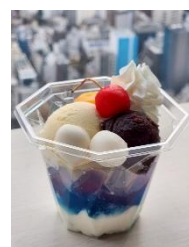
【7月】バックムーン・七夕 ギャラクシーあんみつ