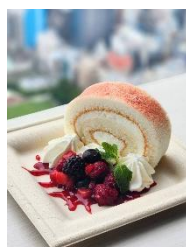
【6月】ストロベリームーン ストロベリームーンロール