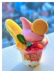
【5月】フラワームーン フラワームーンミニパフェ