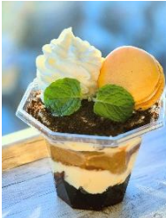
【1月】ウルフムーン ウルフムーンティラミス