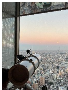
天体望遠鏡イメージ