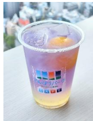
【2月】スノームーン スノームーンソーダレモネード