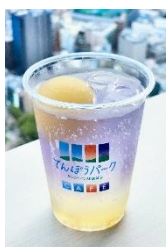
【12月】コールドムーン コールドムーンソーダレモネード