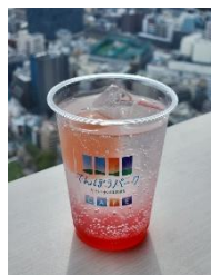
【4月】ピンクムーン ピンクムーンソーダ