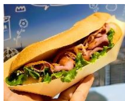
【10月】ハンターズムーン ビーフバインミー