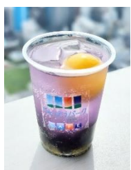
【8月】スタージオンムーン スタージオンムーンソーダレモネード