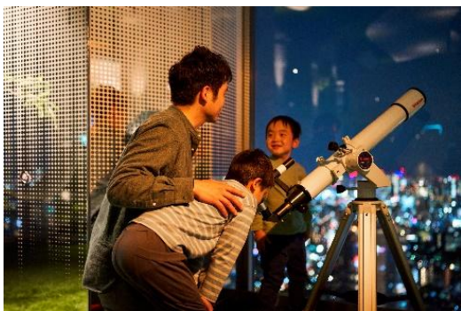
天体望遠鏡を用いた観賞会のイメージ

「空の公園」をコンセプトとする「サンシャイン60展望台 てんぼうパーク」（東京・池袋）では、「てんたいパーク」と題し、年間を通して様々な天体観賞会を実施しています。