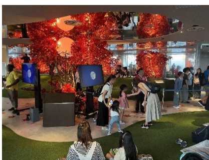
過去開催の満月観賞会の様子