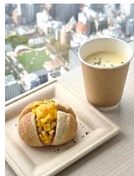
【9月】コーンムーン コーンムーンコンボ