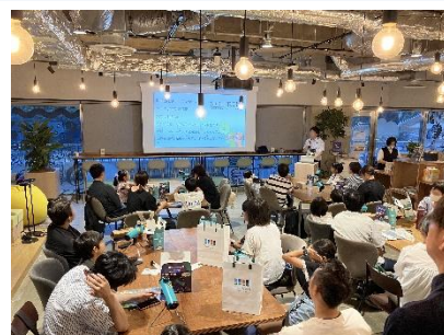
過去開催の天体望遠鏡ワークショップの様子