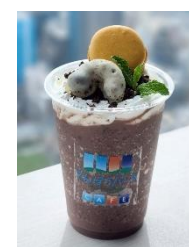
【3月】ワームムーン ワームムーンショコラ