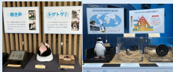
「世界ペンギンの日編」の展示の様子

生き物の魅力を楽しみながら学べる体験コンテンツが満載となり、環境保全への意識を高めていただける機会となりました。