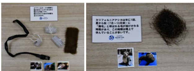
※カワウソのカプセルには、布の切れ端やホースなどの中から1種入っています ※シールは一部のカプセルに入っています

また、本ガチャの売上は、「ShoeZ」を通じて、 生き物の保全活動をしている団体へ全額寄付されます 。生き物たちのリアルに触れながら、ぜひガチャを回してみてください！