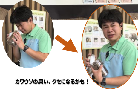
カワウソの臭い、クセになるかも！

例年「カワウソの臭いクンクンボックス」が展示されていましたが、今年の「世界カワウソの日編」では、新たにカワウソの個体ごとの臭いを嗅ぎ比べることができる、「カワウソの利き臭いクンクン装置」が登場します。カワウソの臭いは、年齢、性別、生殖状態を知らせるコミュニケーションツールとして知られています。特にオスの臭いは強く、酸っぱく鼻にツンとくる臭い。勇気をもって装置をクンクンしてみてください。これであなたもカワウソ臭いツムリエになれるかも・・・！？