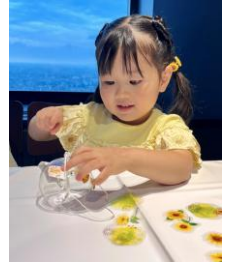
オリジナル風鈴作り