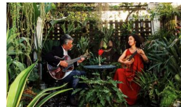
ウクレレコンサート