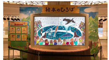
「絵本のひろば」の大画面テレビ絵本