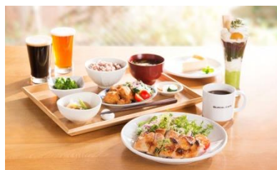
GLOCAL CAFE メニュー例

営業時間：平日 7:30～22:00 / 土日祝 8:30～22:00 (ラストオーダー21:30)