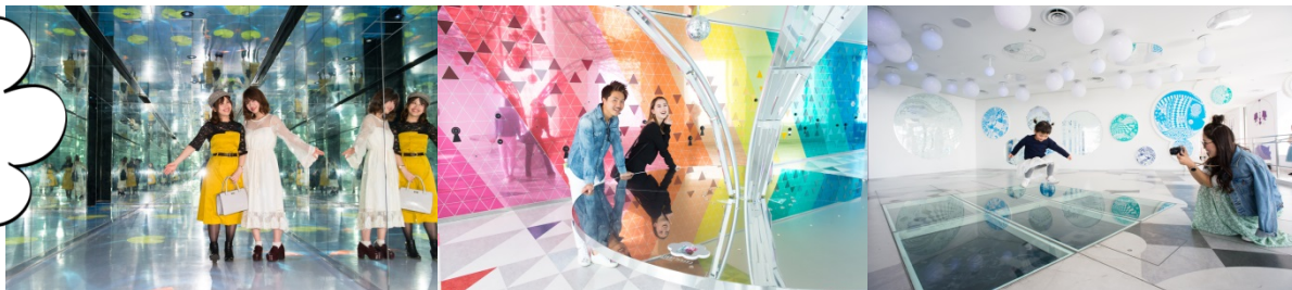
※画像はすべてイメージです。※金額はすべて税込です。