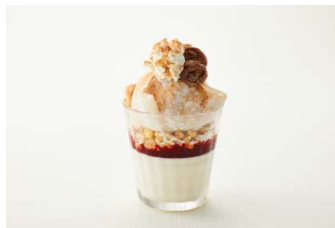
「甘い？ すっぱい？」スパイマンパフェ(750円)