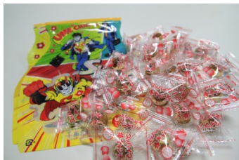
梅キャンディーの詰め放題（500円）

展望台チケットカウンターに設置したフォトスポットで写真撮影をして、ハッシュタグ「#スカイサーカス」を付けて Twitter または Instagram に投稿した画像をチケット購入時に提示いただくと、「甘梅一番シール」をプレゼントします。※なくなり次第終了