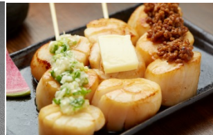
ホタテ串 (1 串 300 円)