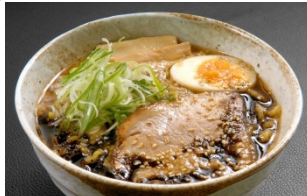
熟成黒味噌らーめん (900 円)