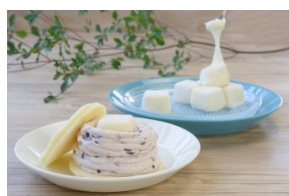
左:おもちーず入り生白どら (1 個 500 円)