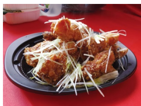
北斗流ザンギねぎまみれ (700 円)