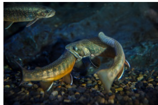
オシヨロコマ