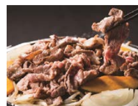
ジンギスカン(各種 900 円)

屋外特設会場では、海鮮や肉を炭火焼きで堪能できるほか、サッポロビールとジンギスカンを味わえるビアガーデンも登場します。 ※荒天中止