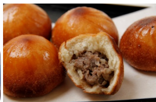
揚げ一口鹿まん (250 円)