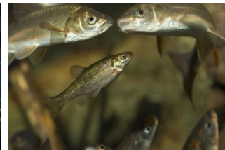
ヤチウグイ