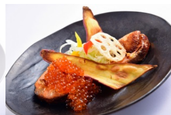
秋鮭の香り焼 イクラ掛け (950円) 鹿児島郷土料理 さつま翁 [アルパ B1]