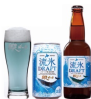
流水ドラフト (瓶 480 円)