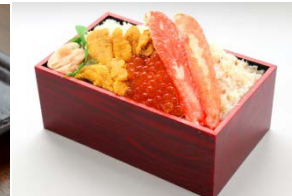
豪快三食弁当 (2,160 円)