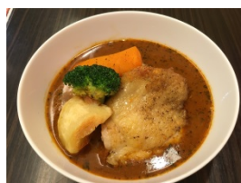
スープカレー (950 円)