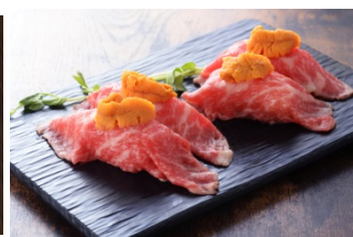
道産牛の雲丹のせサーロイン肉寿司(4 貫 1,600 円)