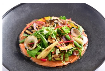
旬菜と秋鮭のマリネ (2,376円) ジンジャーズビーチ サンシャイン [スカイレストラン 59F] ※各日ディナータイム限定

専門店街アルパ飲食店・スカイレストランでは9月27日(木)~10月31日(水)の期間、「十勝彩美牛」や「道東産いくら」、「秋鮭」、「玉ねぎ(札幌黄)」など北の海と大地の食材を使用したメニューを提供します。(参加店舗8店)