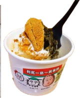
愛す利尻山 (600 円)