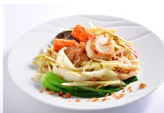
本日おすすめの海鮮と彩り野菜、北海道産幻の玉ねぎのXO 醬炒め (2,980円) ジョーズシャンハイ [スカイレストラン 59F] ※各日ディナータイム限定5食