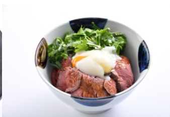
十勝彩美牛のローストビーフ丼 (お味噌汁・お新香付) (1,500円) グローバルカフェ[アルパ 1F] ※各日11時~限定30食