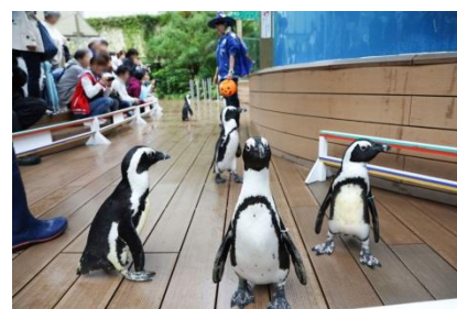
いきものハロウィンパレード

サンシャイン水族館にご来場の際は、生き物たちだけでなく、飼育スタッフにもぜひご注目ください。