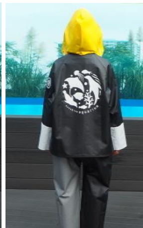
サンシャイン水族館オリジナルデザイン マリンブルゾン

サンシャイン水族館(東京・池袋、館長:丸山克志)では、10月13日(土)よりペンギンの飼育スタッフウェアとして、株式会社アーバンリサーチが取り組んでいるJAPAN MADE PROJECTと東北の若手漁師集団「FISHERMAN JAPAN」とのコラボレーションで制作された漁師ウェアのサロペットパンツと、サンシャイン水族館オリジナルデザインのマリンブルゾンを導入します。