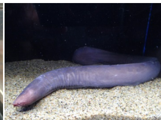
ヌタウンギの仲間