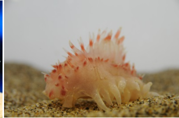
ヒメカンテンナマコ