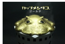
カップメンダコ サンシャインゴールド

メンダコを中心としたオリジナル商品、「オリジナルメンダコブックマーカ―」(378円)、「カップメンダコ サンシャインゴールド」(3,456円)、「メンダコキャンドル」(1,250円)や、深海生物グッズのほか、角川文庫「深海カフェ 海底二万哩」を販売します。