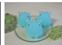
メンダコキャンドル