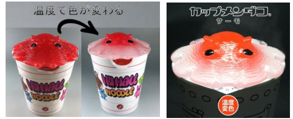
カップメンダコ サーモホワイト

いきものグッズ特化型ネットショップ「いきもーる」( http://ikimall.ikimonopal.jp )内で『深海グッズ特集』を実施します。いきもーるの人気グッズであるカップラーメンのフタになる「カップメンダコ」や、いきもーるだけの限定販売新商品『温度で色が変わる!「カップメンダコ サーモ』』の他、アクセサリや生活雑貨など約120種類の深海グッズを特集して販売します。