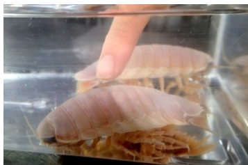
ゾクゾクタッチ (オオグソクムシ)

この冬は是非、サンシャイン水族館で今しか見ることのできない珍しい深海生物たちを様々な角度からお楽しみください！ ※採集状況や生物の状態により展示内容・イベント内容が変更になります。