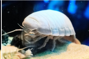
ダイオウグソクムシ