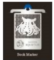
オリジナルメンダコブックマーカ―