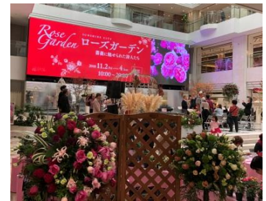
昨年の会場の様子

カットローズ（切り花）協力：石田バラ園/市川バラ園/岡崎園芸/神生バラ園/ 熊谷園芸/堀木園芸/柳井ダイヤモンドローズ/Rose Farm KEIJI