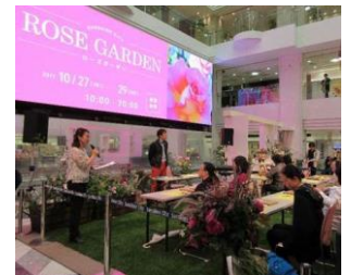
ステージイベント イメージ