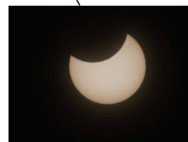
部分日食イメージ

※部分日食を望遠鏡で見ることは危険です。絶対におやめください。また、肉眼で直接見ることも危険です。太陽観察用の日食グラスなどが必要です。