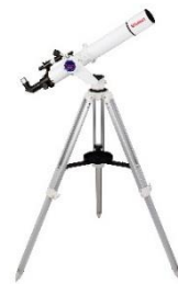
天体望遠鏡イメージ

内容：①ビュッカメラ専門販売員による解説 ②カメラと接続したモニターでの部分日食観測