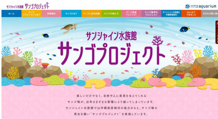
サンシャイン水族館サンゴプロジェクトWebサイト