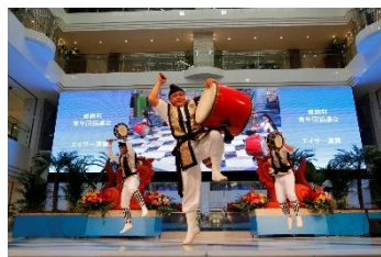
エイサー演舞（イメージ）