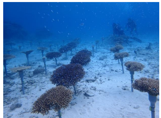
沖縄県恩納村のサンゴ育成場