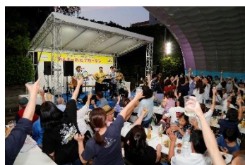
三線ライブ（イメージ）