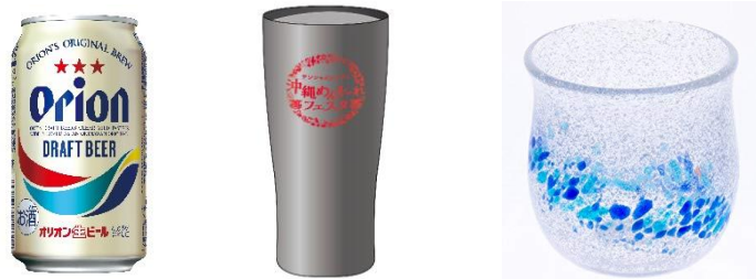
「おうちにプレゼント！」で当たるプレゼント（イメージ）

サンシャイン水族館では、「サンゴプロジェクト」と称しサンゴの保護と啓発活動を推進しています。今回の本イベントでは、サンゴについて知っていただくため、クロスワード型のクイズコンテンツを実施します。サンゴプロジェクトのWebサイトを参考に、導き出される特定のキーワードをフォームに入力すると、サンシャイン水族館オリジナルのバーチャル背景をプレゼント。