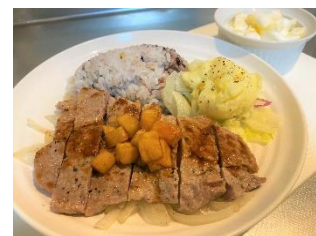
お土産アレンジレシピ（イメージ）

沖縄と言えばオリオンビール。オリオンビールに合う絶品おつまみレシピを公開します。