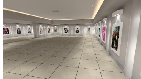
CGで制作したイベント空間イメージ