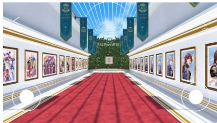
アプリ内の展覧会