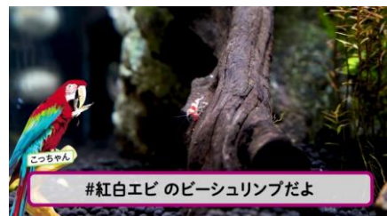
アプリ内の生物解説