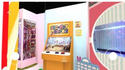
アプリ内の特別展会場