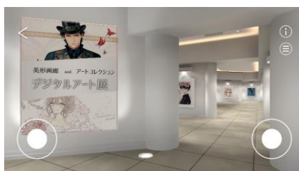
アプリ内の展示会場