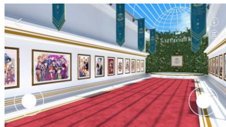
アプリ内の展覧会