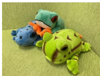
左 アニマニア コバルトヤドクガエル 上 アニマニア アカメアマガエル 右 アニマニア ベルツノガエル 各1,320円