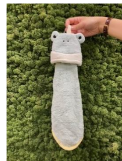
アニマルタオルマスコット カエル 550円