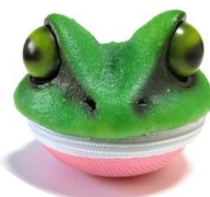
コイン・イヤホンケース(アマガエル)(6,000円)