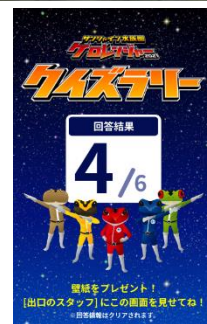
クイズラリー回答結果画面イメージ

お手持ちのスマートフォンで楽しめるクイズラリー。ケロレンジャーとして活動するカエルの生態や環境問題をテーマに、鳴き声、映像、画像などを使用した解説とともにクイズをお楽しみいただけます。すべてのクイズに回答した方には、スマートフォンでご使用いただけるオリジナルの壁紙をプレゼントいたします。※壁紙は全2種（6月4日～20日／6月21日～7月4日で1種ずつ配布）。