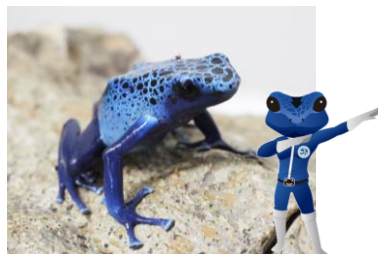
アイゾメヤドクガエル(コバルトタイプ) ケロブルー