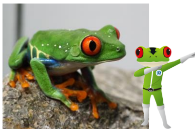
アカメアマガエル ケロレッドアイ