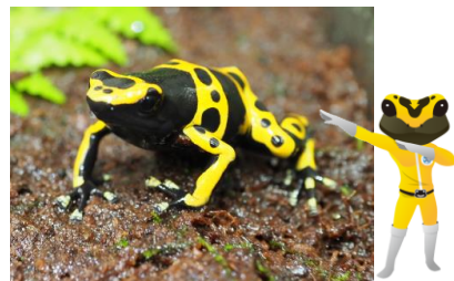
キオビヤドクガエル ケロイエロー