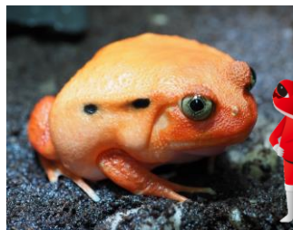
アカトマトガエル ケロレッド