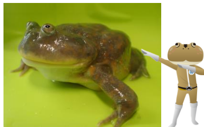
マルメタピオカガエル ケロブラウン