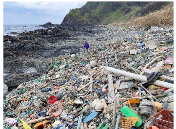
海洋ゴミの写真