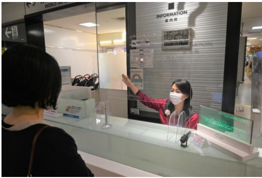
音声認識技術を活用したご案内の様子