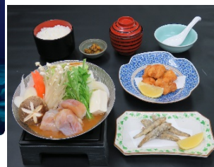
つきじ植むらイベントコラボメニュー 「あんこう鍋ご膳」