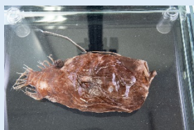
ミツクリエナガチョウチンアンコウ(液浸標本)

深海生物の中には擬似餌でエサとなる生き物を誘い捕食するものもいます。擬似餌の大きさや形は生き物によって異なります。