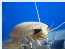
オオゴソクムシ(生体展示)