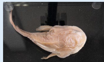
ニュードウカジカ(液浸標本)