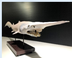
ミツクリザメ(剥製標本)