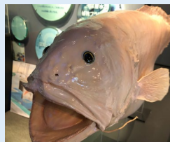
謎の深海魚(剥製標本)