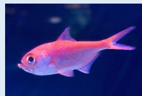
キンメダイ(生体展示)