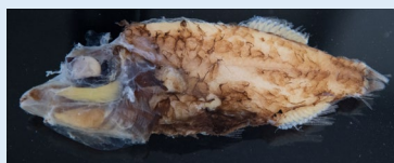
デメニギス(液浸標本)

暗闇の中でわずかな光を有効に集めるため、浅瀬の生き物とは異なる眼の構造を持つ深海生物もいます。