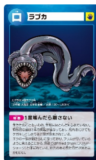
ゾクゾク深海カード

※各達成条件ごとに絵柄が異なります。※全2種の場合はランダム配布となり、絵柄は選べません。