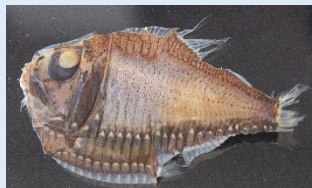
オオホウネンエソの仲間(液浸標本) ワニトカゲギスの仲間(液浸標本)

暗闇の中で腹部を光らせることで身を隠す「カウンターイルミネーション」という特徴を持つ生き物や、光を用いてエサとなる生き物をおびきよせる生き物もいます。