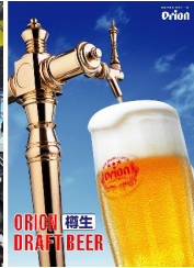
オリオンビール 生ビール 500円