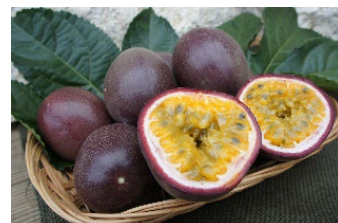
おんなの駅 なかゆい市場 パッションフルーツ 1,300円 ※仕入れ状況等により価格が変更する場合があります。