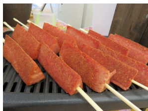
OKINAWAN BAR MAMIANA スパム串 400円