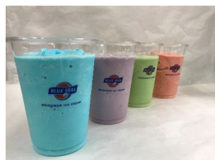
ブルーシール アイスシェイク 各590円