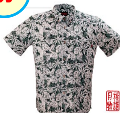
月桃物語 紳士かりゆしウェア 10,780円