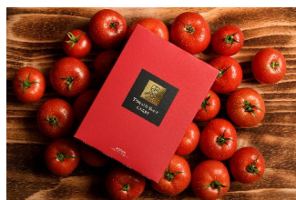
おんなの駅 なかゆい市場 大城さんの贅沢トマトカレー 680円