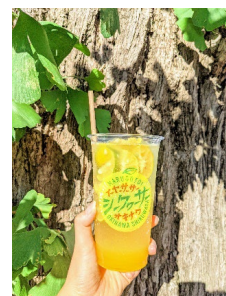
想いっきり沖縄 シークワーサーハイボール 600円