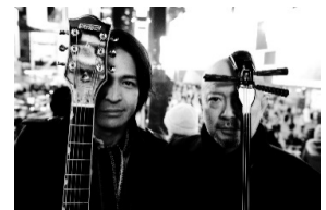
THE SAKISHIMA meeting