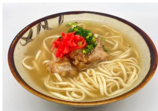
想いっきり沖縄 沖縄そば 700円