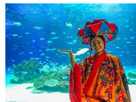
南国の浅瀬をイメージした大水槽 「サンシャインラグーン」

サンゴプロジェクト詳細はこちら▶ https://sunshinecity.jp/file/aquarium/coral_project/