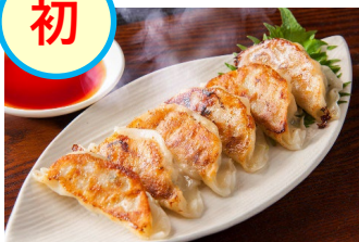
美ら園 あぐー餃子(焼餃子) 900円