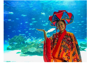
南国の浅瀬をイメージした大水槽「サンシャインラグーン」

サンゴプロジェクト詳細はこちら▶ https://sunshinecity.jp/file/aquarium/coral_project/