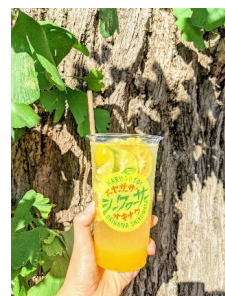
想いっきり沖縄 シークワサーハイボール 600円