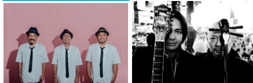
きいやま商店 ●17:00～ THE SAKISHIMA meeting ●18:30～