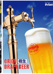
オリオンビール 生ビール 500円