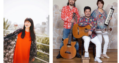
石垣優 ●17:00～ DIAMANTES ●18:30～