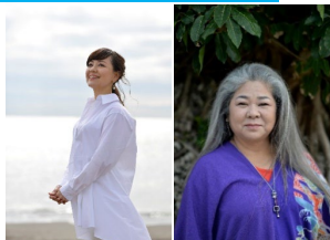
普天間かおり ●17:00～ 古謝美佐子 ●18:30～