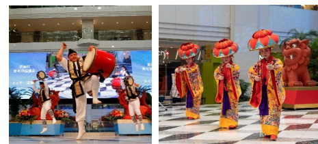
沖縄県&恩納村 おきなわ祭り