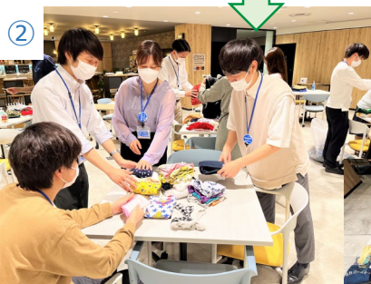
② 集まった子ども服をサンシャインシティ グループ社員で畳む様子