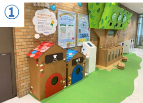
① サンシャインシティ 専門店街アルパ 1F北広小路に設置 『子ども服回収ボックス』

この度、回収ボックスに寄せられた子ども服921着(6月27日時点)を認定NPO法人豊島子どもWAKUWAKUネットワークに寄付しました。同法人より、子ども服を必要としている豊島区の各ご家庭のお子様へ届けられる予定です。サンシャインシティではこの後も引き続きまだ着られる子ども服を集め、必要とされる場所へお届けする活動をしてまいります。