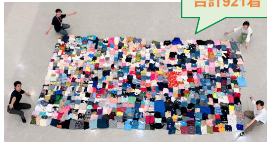
7月1日(金) 認定NPO法人豊島子どもWAKUWAKU ネットワークに集まった子ども服を寄付しました！