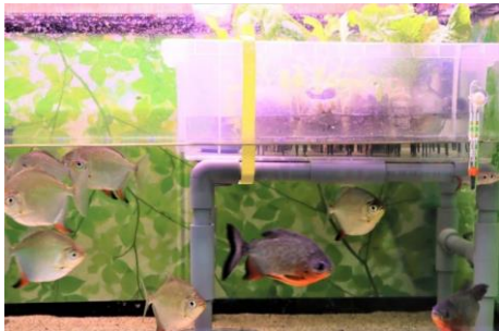
サンシャイン水族館の事務所に 設置されたアクアポニックスの実験用水槽