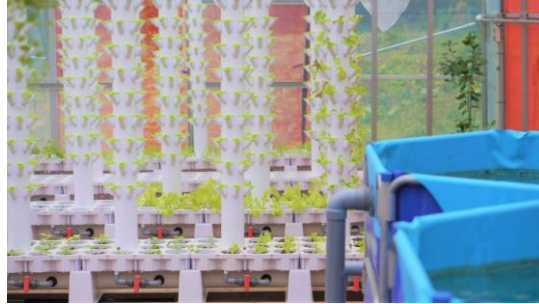
Iwakura Experienceが活動する敷地内に建てた ビニールハウス内のアクアポニックス