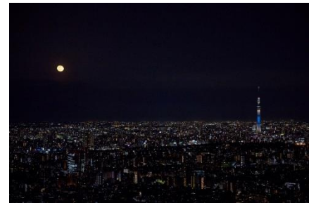
「日本百名月」に認定された景色

※一般社団法人夜景観光コンベンション・ビューローが後世に残したい名月を一定基準のもとに「日本百名月」として認定