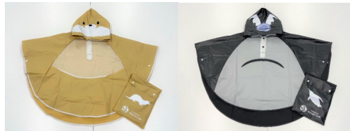
サンシャイン水族館オリジナルレインポンチョ（子ども用） 各2,475円