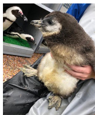
2月21日生まれの子ちゃん