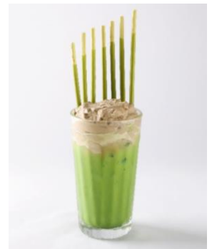
茶鍋カフェ・カグラザカ サリウ (アルパ1F) メニュー名：抹茶とほうじ茶クリームラテ 「ポッキー」の種類：ポッキー <濃い深み抹茶> 甘さ控えめの抹茶ラテに自家製ほうじ茶クリームと抹茶ポッキーをトッピング。ほうじ茶クリームにポッキーをたっぷりつけてお楽しみください。