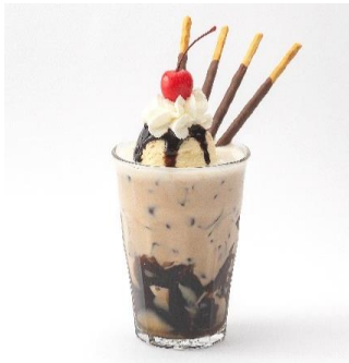
アンカーズ グリル&スイーツ (アルパB1) メニュー名：とろけるコーヒーゼリーオレ 「ポッキー」の種類：ポッキー-TASTY 香り高いオリジナルブレンドコーヒーをミルクで割ったカフェ・オ・レと、なめらかなコーヒーゼリーをかき混ぜながら楽しんで！