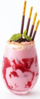
CHEESE&DORIA.sweets (アルパ3F) メニュー名：2種ベリーのチーズラテ 「ポッキー」の種類：ポッキー・チョコレート 木苺ビュレと苺シロップをミルクで割り、マスカルポーネホイップをトッピングしたスイーツ感覚のチーズラテ！