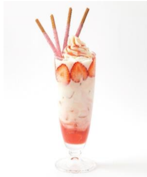
ラ・メゾン アンソレイユターブル (アルパ3F) メニュー名：ベリーヨーグルトドリンク 「ポッキー」の種類：つぶつぶいちごポッキー 果実感のあるベリーヨーグルトと、さっぱり爽やかなドリンクの組み合わせがおすすめ！