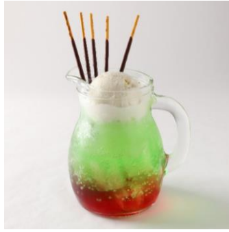
アジオ (アルパ3F) メニュー名：AGIOのクリームソーダ 「ポッキー」の種類：ポッキー極細 大人気の懐かしいクリームソーダをAGIOカラーの赤×緑で再現！