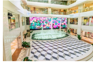
サンシャインシティ 噴水広場

第25回えほん大賞公式ウェブサイト： https://www.bungeisha.co.jp/ehon/