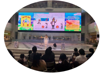
絵本の読み聞かせ会