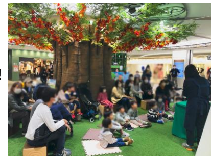
※サンシャインシティ内「絵本のひろば」での読み聞かせの様子

※読み聞かせ会の時間以外は「出張版・絵本のひろば」で絵本を読んだり、休憩したりできます。