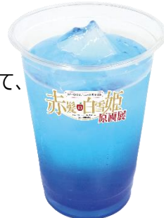
ゼンのブルーライチドリンク 950円