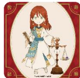
購入特典 コースター