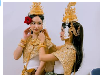
カンボジアの伝統的なダンス