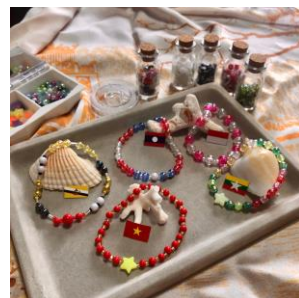
オリジナルブレスレット作り