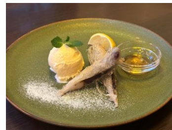
にっぽんの宝物 東京としま大会 2022-2023 グランプリ受賞 「あみあみスイーツ揚げ春巻き」

会場内キッチンエリアでは、池袋の人気ベトナム料理店「サイゴンレストラン」が来店。お店で人気のベトナム料理やベトナムコーヒーなど本場の味を提供します。また、「にっぽんの宝物 東京としま大会2022-2023」でグランプリを受賞した日本のあんこや餅とベトナムの生春巻きを使用した日本×ベトナムの新感覚スイーツ「あみあみスイーツ揚げ春巻き」も登場し、様々なグルメを楽しめます。