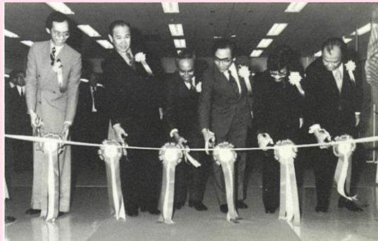
ASEAN貿易投資観光促進暫定センターのオープンに際し、テープカットする各国代表

その時のご縁より、「サンシャインシティワールドフレンズフェスタ」は日本アセアンセンター協力のもと、イベント開催に至りました。※現在事務所は御成門（東京・新橋）に所在