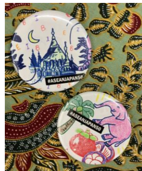
オリジナル缶バッジ作り