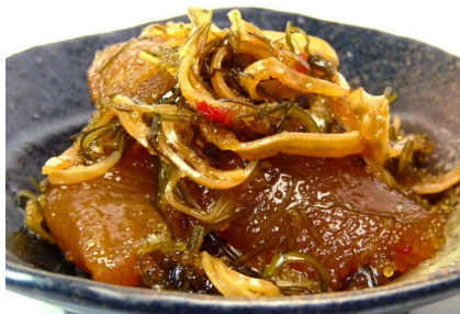
グルメ数の子松前漬