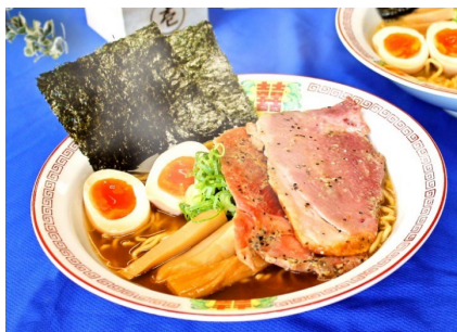
黄金比拉麺 醤油SPセット