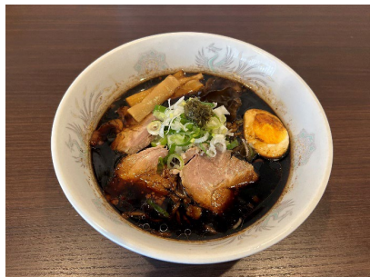
ブラック 函館がごめ昆布のせ