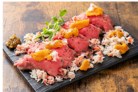
道産牛の肉寿司～雲丹カニまみれ～