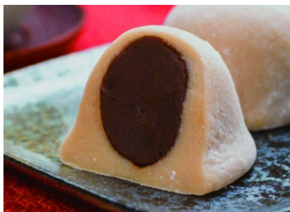
ぼんちせこーヒー大福