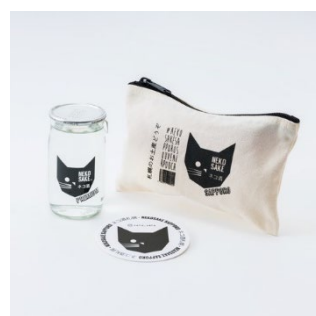
北海道限定 ネコ酒札幌お土産ポーチ