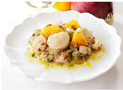
白ワインにあう北の生マリネ