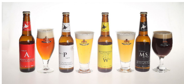
オホーツクビール