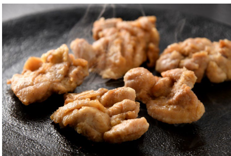
極みの塩ザンギバス