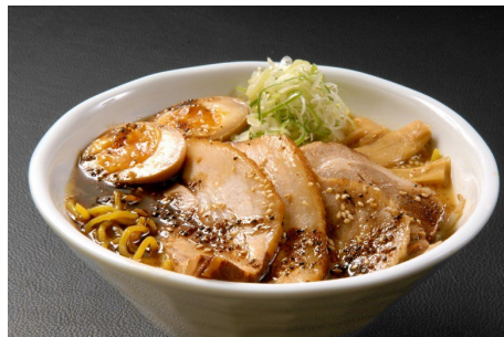
濃厚焼豚焦がし味噌らーめん