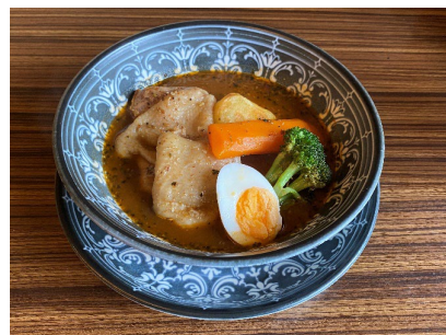
北海道産チキンスープカレー