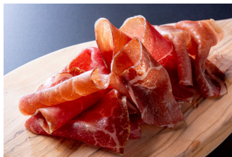
北海道産牛の生ハム