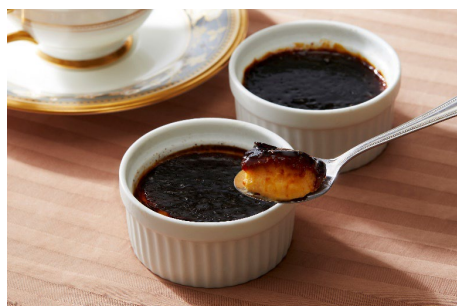
クレーンプリュレ