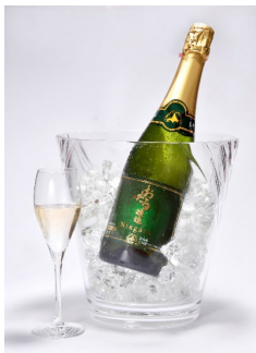
おたるナイヤガラ スパークリング