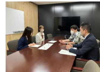
グッズ制作会社とのミーティングの様子