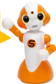
コミュニケーションロボット「Sota®」