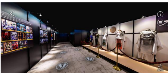
「メディアミックスの間」