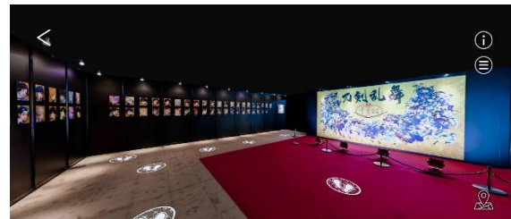
「五周年記念大祝画の間」