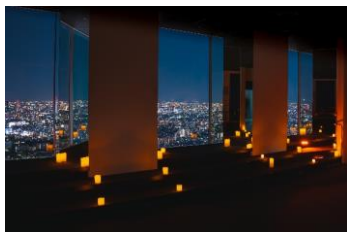
消灯した展望台内からの夜景

9月18日(土)～24日(金)の期間、展望台内の一部の照明を消灯し、夜景を観賞しやすく、心安らぐ空間をお楽しみいただけます。また、タリーズコーヒーサンシャイン60展望台店では、展望台から見える月が描かれたハーベストムーンコアを販売します。