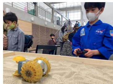
月面探査車「YAOKI」 月面探査ミッション(イメージ)

※サンシャイン60展望台ではお客様に安心してご来館いただくため、新型コロナウイルス感染症拡大防止に努めております。ご来館の際には、ご理解とご協力をお願いいたします。詳しくは公式ホームページをご確認ください。 https://sunshinecity.jp/observatory/news/entry-15407.html