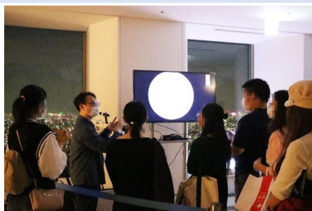
過去の天体観賞会の様子