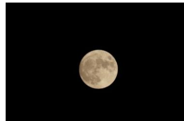
2020年展望台から撮影した中秋の名月