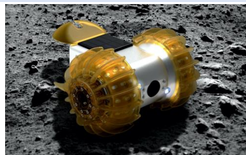
日本製の月面探査車「YAOKI」

SKY CIRCUS サンシャイン60展望台（東京・池袋）では2021年度、天体観賞会を8回実施予定です（下部参照）。 9月18日(土)～24日(金)の期間は、「中秋の名月」として月にまつわるイベントを開催いたします。