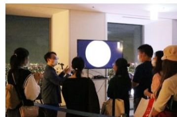
天体観賞会の様子