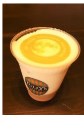
ハーベストムーンコア(693円・税込)

※サンシャイン60展望台ではお客様に安心してご来館いただくため、新型コロナウイルス感染症拡大防止に努めております。ご来館の際には、ご理解とご協力をお願いいたします。詳しくは公式ホームページをご確認ください。 https://sunshinecity.jp/observatory/news/entry-15407.html