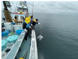
水中ドローンを海へ

展示から53日目となった現在も状態良好で、腕を広げて体を大きく見せるような姿や、アクロバティックな動き、定期的にエサを食べる様子等、今までのメンダコでは見たことのないような動作も観察することができています。サンシャイン水族館では今後も長期飼育で得られるデータを確実に収集し、未知の部分が多い深海生物についての魅力を発信してまいります。