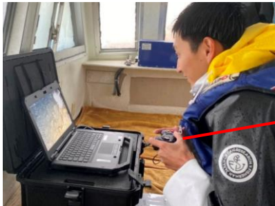
船上で水中ドローンを操作する様子