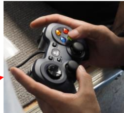
水中ドローンのコントローラー