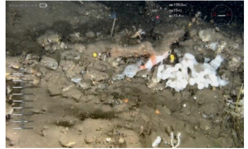
水中ドローンで撮影した映像