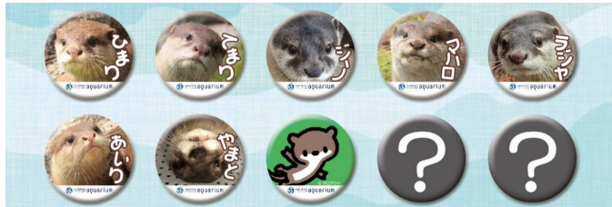
カワウソトレーディング缶バッジ第2弾(ランダム) 各350円