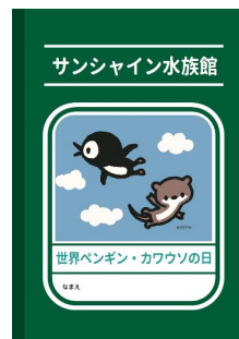
ノート (B6サイズ) 300円