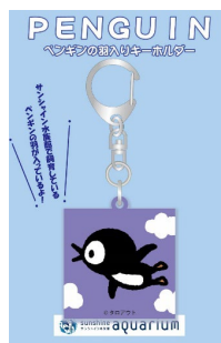
ペンギンの羽入りキーホルダー 495円