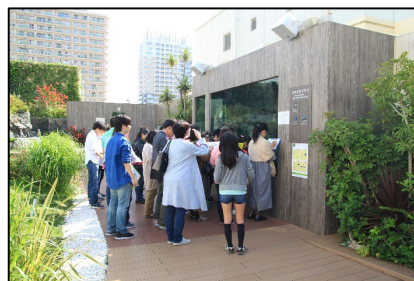
過去開催時 参加者がカワウソを観察する様子

※状況により、内容・スケジュールが変更になる場合がございます。※画像はイメージです。※金額はすべて税込です。