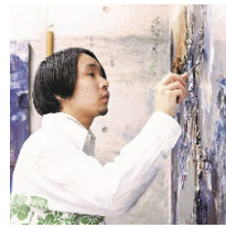
創形美術学校 SOKEI ACADEMY OF FINE ART & DESIGN

「本物にふれる 本当の力をつける」 池袋駅西口より徒歩5分、創形美術学校は「アート」と「デザイン」を学べる3年制の専門学校です。指導するのはすべてプロのクリエイター。一步一步ともに歩む姿勢で創造するよこびを伝え、眠っている才能とゆるぎない力を引き出します。