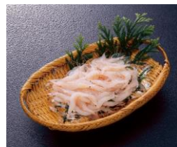
富山の名産！ 富山湾産白エビ

日時：9月30日（土）～10月22日（日）11:30～23:00（L.O 22:00）