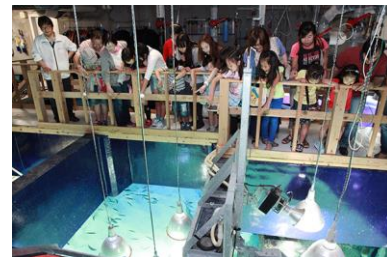
バックヤードツアーイメージ

※東京都に本社を置く、薬局を運営する企業。「アイランド薬局」「薬局アポック」などの薬局を北海道から関西まで展開している。