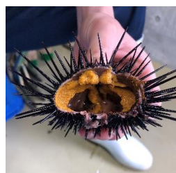
ウニとやさいクルプロジェクト 畜養中のウニ

株式会社サンシャインシティが、サンシャインシティを飛び出して運営する、新たな「なんかが面白いこと」、新たなまちのコミュニティ拠点です。当社が所有する池袋駅東口前のビルを減築・リノベーションし、PAPPILON BLDG.（パピヨンビル）として3月に開業し、ビルの全フロアを用いてPUBやイベントスペースが複合した施設P-144（ピーイチヨンヨン）を運営しています。