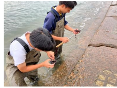
氷見高校の生徒がウニを駆除する様子

全国各地で起きている“磯焼け”というウニなどが海藻を食べつくし、漁場が荒れてしまう問題に対し、富山県氷見市では富山湾で通常駆除されるウニに、地元の廃棄される野菜をエサとして与え、ウニを商品化する取り組み「ウニとやさいクルプロジェクト」活動を地元高校生が中心になって行っています。地域の農家、学生、漁業組合などが連携し、一体となり取り組む例は、環境問題解決の重要なヒントになるはずです。今回、この取り組みの紹介と実際に駆除・畜養されたウニを展示します。